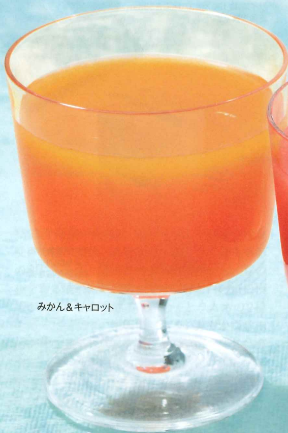
みかん&キャロット